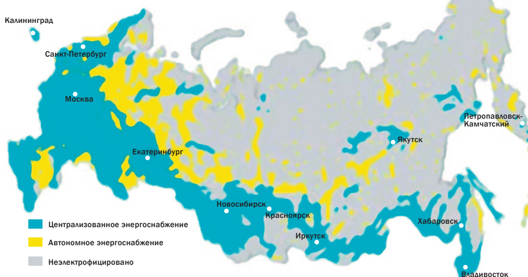
Рис. 1. Распределение локальных изолированных систем энергоснабжения

Суммарную стоимость дизельного топлива для выработки электроэнергии на ДЭС в изолированных системах энергоснабжения (с учетом его доставки) в 2015 году можно оценить близкой к 60–80 млрд руб. К этому следует еще добавить стоимость масла – примерно 4 млрд руб. Источники малой мощности, используемые для автономного