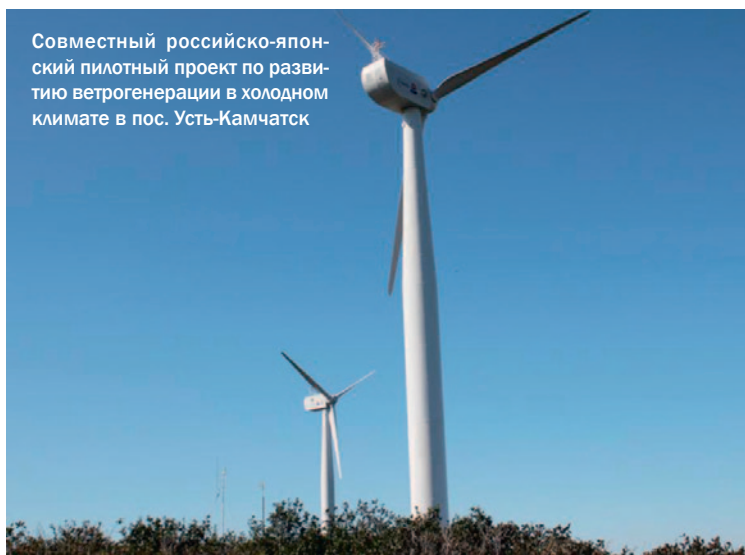
Совместный российско-японский пилотный проект по развитию ветрогенерации в холодном климате в пос. Усть-Камчатск

Перевод котельных на возобновляемые виды топлива возможен лишь при условии гарантированных стабильных