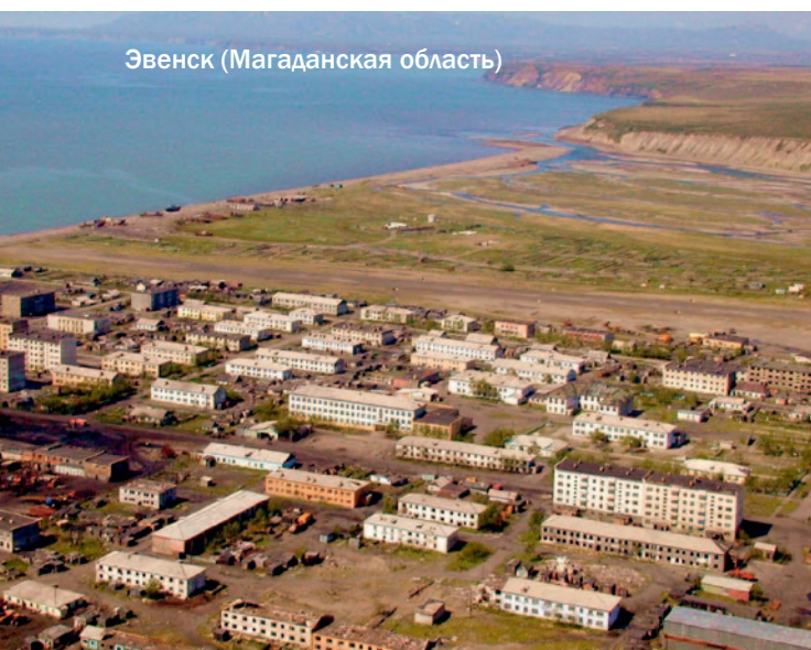
Эвенск (Магаданская область)