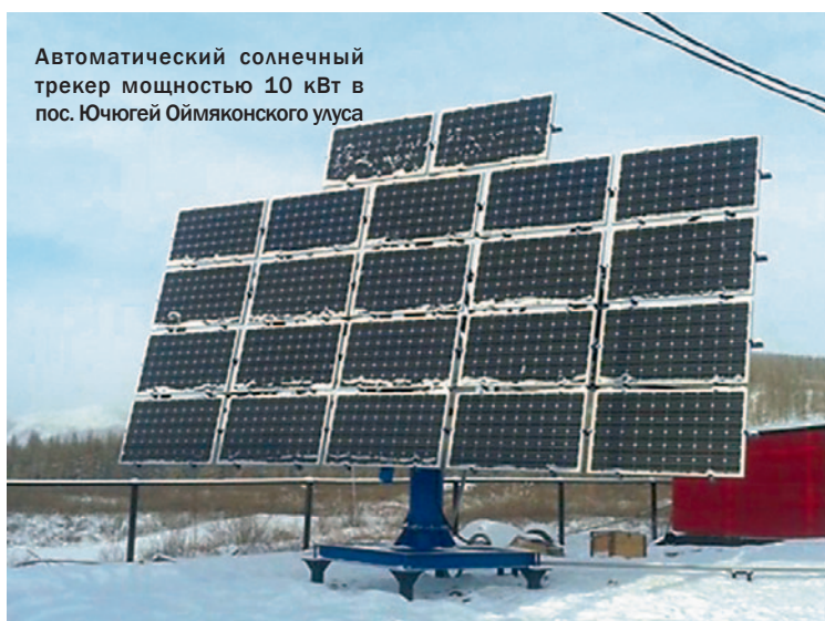
Автоматический солнечный трекер мощностью 10 кВт в пос. Ючюгей Оймьяконского улуса