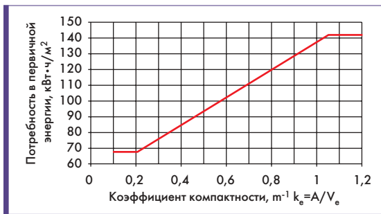
Рис. 1. Нормативы по удельному потреблению первичной энергии для жилых зданий

Законом усиливается роль сертификата энергоэффективности зданий. Сертификат энергоэффективности здания должен включать контрольные величины, имеющиеся в существующих утвер-